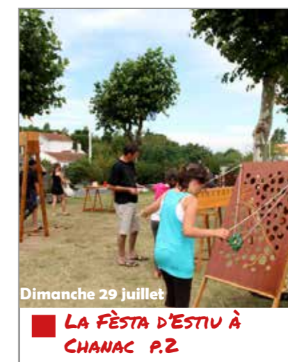
Dimanche 29 juillet